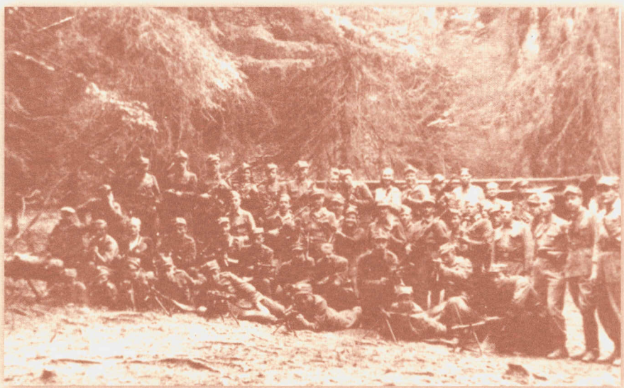
Oddział ochrony sztabu Józefa Kurasia „Ognia” - Gorce