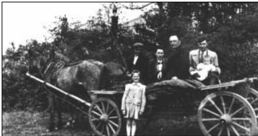
Rodzina Łukasiuków przed kościołem w Ruskowie („Młot” siedzi pośrodku grupy na wozie).

i wiary katolickiej. Tak było również i w dwudziestoleciu międzywojennym. W mężenińskim dworze masońscy gospodarze udzielali gościny działaczom komunistycznym pracującym na szkodę niepodległego państwa polskiego (np. przebywał tu po wyjściu z więzienia członek KPP