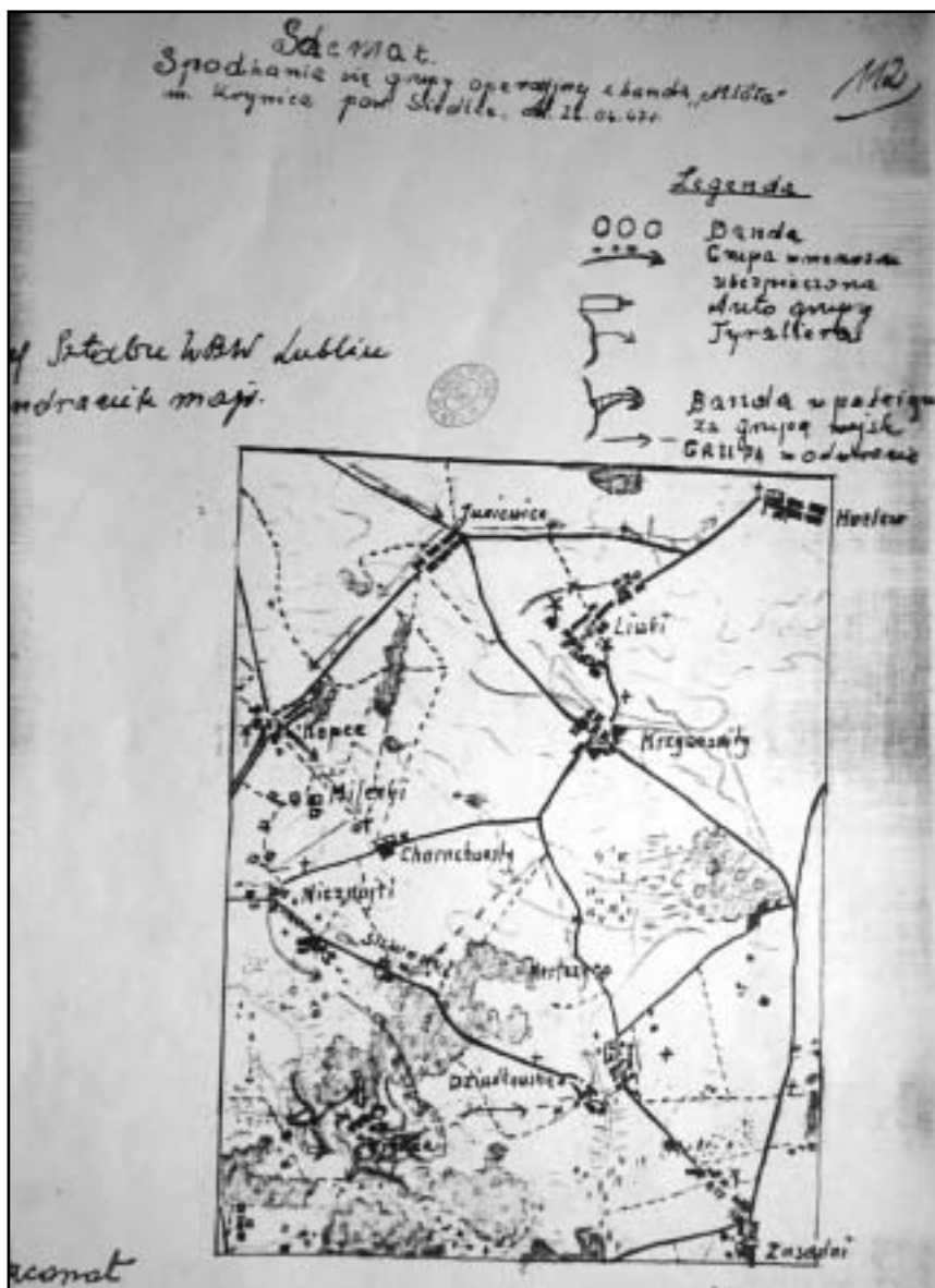
Schemat przebiegu jednej z wielu zwycięskich potyczek oddziału „Młota” z pacyfikującymi teren Podlasia siłami komunistycznymi sporządzony przez KBW.