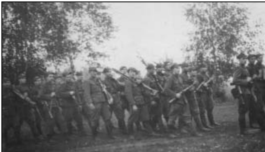
2 szwadron 6 Brygady Wileńskiej AK. Podlasie, jesień 1947 r.

Po rozbiciu głównych sił brygady wiosną – latem 1948 r. kpt. „Młot” raz jeszcze podjął próbę sformowania większej jednostki polowej, łącząc niedobitki 2 szwadronu „Bartosza” z oddziałem „Huzara” (łącznie około 30 żołnierzy w zwartym oddziale). Na ich czele stoczył kilka dalszych walk z obławami w powiecie Bielsk Podlaski. Jednak już w okresie września – października 1948 r. oddział ten podzielony został na małe patrole, które miały większe szanse przetrwania zimy w warun-