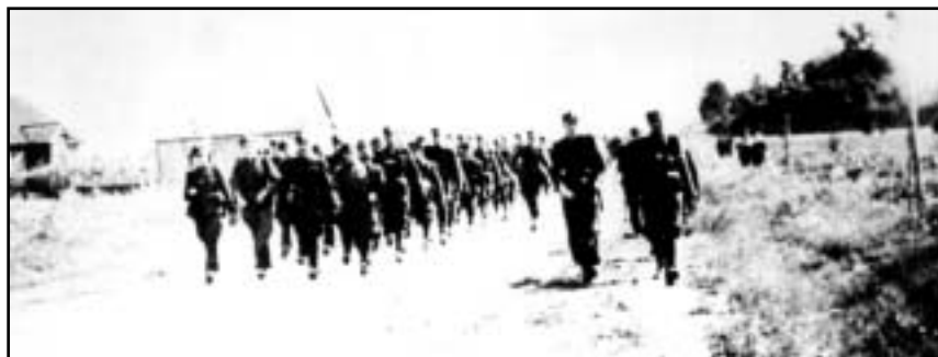
Żołnierze 1 szwadronu 5 Brygady Wileńskiej AK i oddziału „Młota” wkraczający do Jabłonnej Lackiej. 15 VIII 1945 r.

cyjną NKWD i UB we wsi Miodusy Pokrzywne (poległo kilkudziesięciu żołnierzy i funkcjonariuszy przeciwnika).