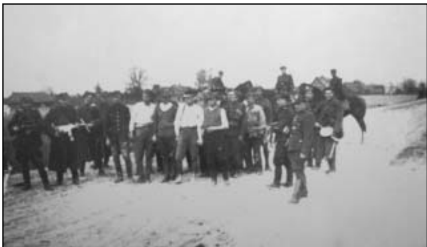
Wzięci do niewoli funkcjonariusze UB i MO w otoczeniu żołnierzy kpt. „Młota” i kpt. „Burego”. Muzyły 28 IV 1946 r.

Do najpoważniejszych operacji bojowych oddziałów „Młota” należy zaliczyć ciężkie walki prowadzone wspólnie z oddziałem PAS NZW