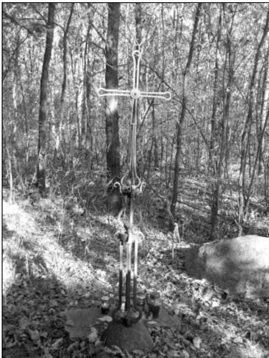
Krzyż na skraju lasu rudzkiego w miejscu śmierci kpt. Władysława Łukasiuka „Młota”.