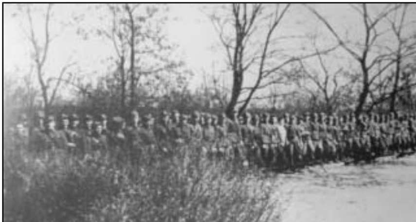
6 Brygada Wileńska AK na zbiórce. Podlasie, okolice Mężenina. 20 kwietnia 1946 r.