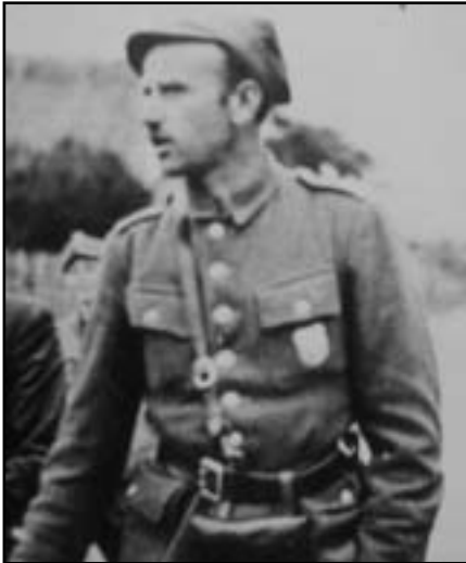
Mjr Zygmunt Szendzielarz „Łupaszka”.

prowadzącym kresowych żołnierzy do boju przeciw komunistom okazał się major Zygmunt Szendzielarz „Łupaszka”, który już w latach okupacji hitlerowskiej stał się postacią legendarną, słynącą z brawurowych działań przeciw Niemcom. Teraz, od lata 1944 r., gdy na nowo odtwarzał i organizował swe oddziały na Podlasiu, oprócz przybyszów z dalekich kresów związali z nim swe losy liczni akowcy znad Bugu i Narwi, znad Nurca i Liwca.